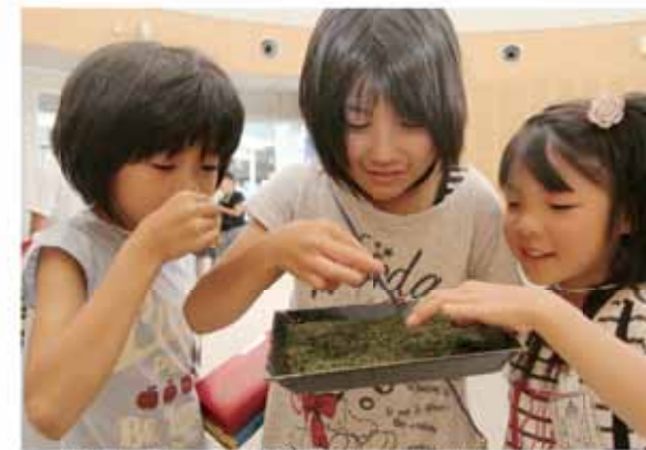
出品された茶葉の色や感触を確かめる菅山小の児童

品評会は一般公開され、市内8小学校の3、4年生約360人は、お茶教室に参加したり、出品された茶葉を手にとったりして香りを嗅ぐなど、普段見ることのできない審査を見学しました。