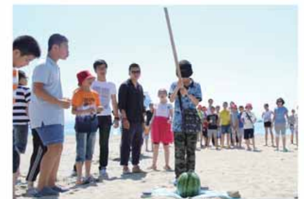
砂浜でスイカ割りを楽しむ中国の小中学生