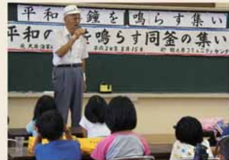
当時の状況と平和の大切さを語る元隊員