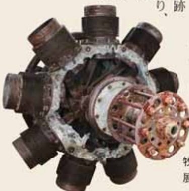
牧之原コミュニティセンターに展示されている白菊のエンジン

いった。 白菊には、爆弾が装備され、教官など選抜された隊員により特攻訓練が開始。当初昼間に行われていた訓練も途中から、夕方や夜間に行われた。7月28日ごろ、同隊は米軍の飛行機であるグラマンの波状攻撃により、司令部や倉庫、格納庫などが被害を受け、隊員の対空射撃により、一機を撃墜したという記録が残っている。 そして、8月15日の終戦により武装解除し、同隊も解散。約3000人いた人々もいつの間にか数百人しか残っていない。なかつた。 戦後昭和22年ごろから、基地のコンクリートは剥がされ、牧之原台地に元の茶畑が再び姿を現した。 同隊は僅か3年という期間でその役目を終えたが、戦後68年が経過した現在でも隊門の一部やレンガ積み壁、防空壕の跡などが残り、当時の様子などを今に伝えている。