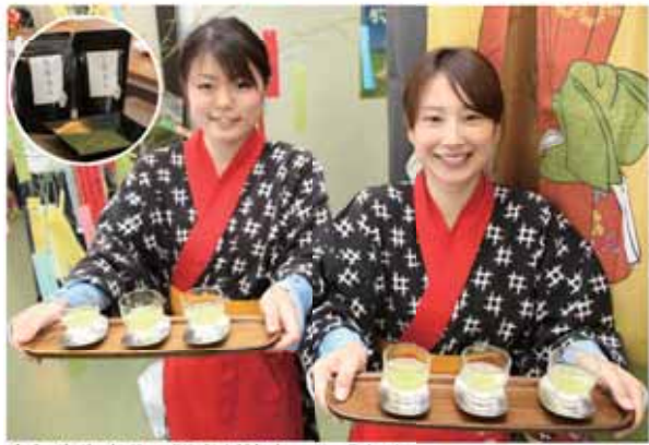
今年度生産分の販売が始まった「白葉美人」