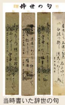
当時書いた辞世の句

今、私がここにいる話ができるのも、今の日本があるのも、国のために戦い、散っていった多くの仲間のおかげ。毎日、家族そろうって食事をしながら生活する、当たり前の日常がいかに幸せかを心から感じています。