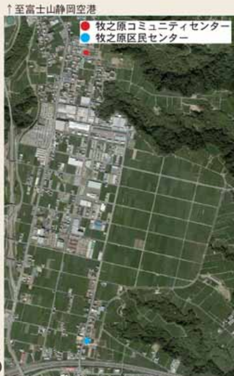
【写真右】現在の様子(平成22年9月撮影)