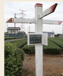
旧牧之原小跡地の記念碑(中原)

昭和20年7月28日の朝の「バリバリバリバリ」というグラマンの機銃掃射が今でも耳に残り、防空壕に逃げる間もなく道に伏せていた。その恐怖は鮮明に覚えています。今は豊かで平和です。災害時もそうですが、これを当たり前と思わないで、もっと平和を大切にしてください。