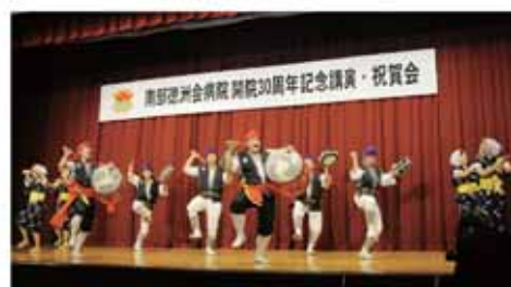
エイサー：沖縄の伝統芸能 南部徳洲会病院開院30周年記念に、地元青年会の皆さん にエイサーを踊っていただきました

病院開院記念日(昭和29 年9月20日)に合わせて、 棟原総合病院祭「棟原お茶 の子彩祭(はいばらおちゃ のこさいさい)」を開催し ます。 これは、皆さんに身近に 感じていただける病院を目 指して、平成11年から13年 まで「ふれあい祭」として、 14年から20年まで「いきい き健康フェア」として開催 してきた病院開院記念行事 です。 今回、3年振りの開催で、 地域住民の皆さんに楽しん でいただけるよう企画して おります。入場は無料です ので、多くの皆さんの来場 をお待ちしています。