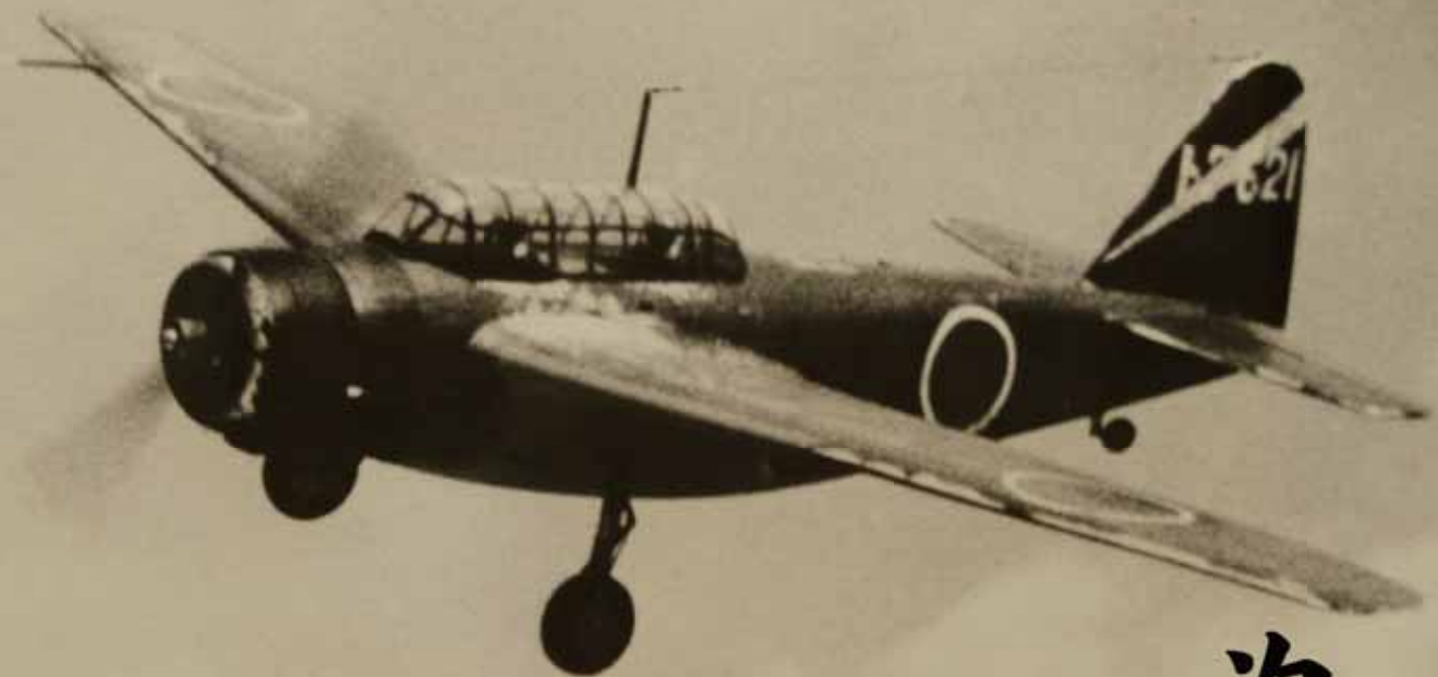
大井海軍航空隊で使用されていたものと同型の練習機「白菊」