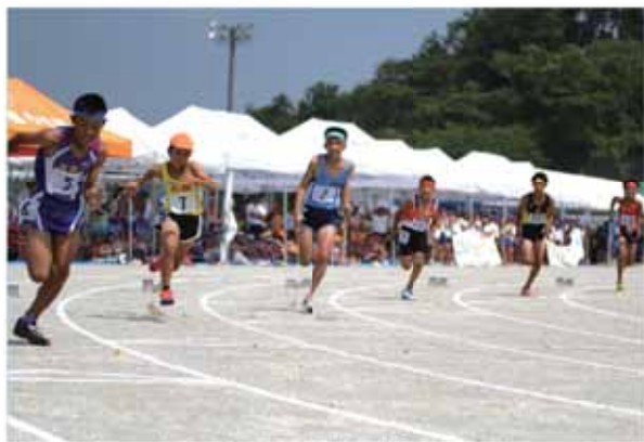
力いっぱいスタートする男子200m走の選手たち

大会には、市内10校、吉田町内3校から6年生を中心に約900人の児童が参加。男女別に設けられた100m走や走り幅跳び、ソフトボール投げなど9種目で、日ごろの練習の成果を競い合いました。選手たちは、仲間や保護者からの大きな声援を受けながら、自己記録の更新を目指して全力を出し切り、熱い戦いを繰り広げました。