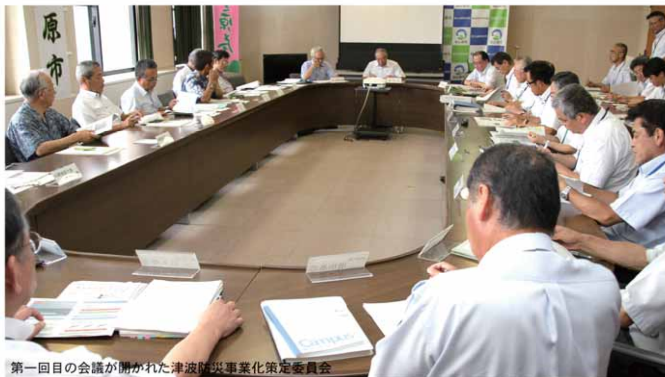
第一回目の会議が開かれた津波防災事業化策定委員会