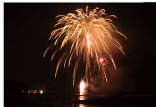
夏の夜空に打ち上がった花火