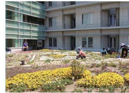
南3病棟の庭園を手入れする会員

連絡協議会に参加してい るさまざまな団体が、それ ぞれ清掃する担当場所を受 け持っています。構内駐車 場や周辺の駐車場、点在す る植え込みなどを、互いに 協力しながら管理していま す。 6月に、正面玄関の植え 込みにさまざまな花を植え ました。また、南館3階の 屋上庭園は、同階のデイ ルームから見ることができ ます。来院された際は、ぜ ひご覧ください。 病院の顔でもある中庭は、