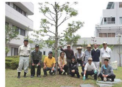
中庭の整備を終えた会員

ていきたいと考えています。 年に一回は、徳洲会の病 院や病院ボランティアの先 進地を視察し、見聞や交流 を広める予定です。また、 会員相互の話し合いの場を 設け、活動についての意見 やアイデアを出し合うこと も計画しています。 同協議会は、利用者であ る住民自身が病院を守ると いう考えで活動に取り組ん でいます。興味のある方 は、ぜひ声を掛けてくださ い。まずは、施設見学も含 め、活動の場所をご案内し ます。 会員の皆さんと一緒に、 病院運営のお手伝いをして くれる方をお待ちしていま す。