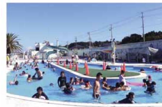
友達や家族など、みんなで楽しく利用してください