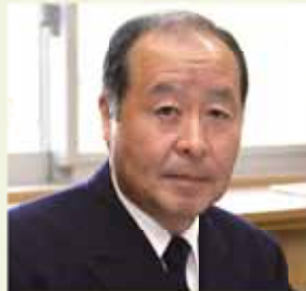
牧之原市相良 消防本部消防長