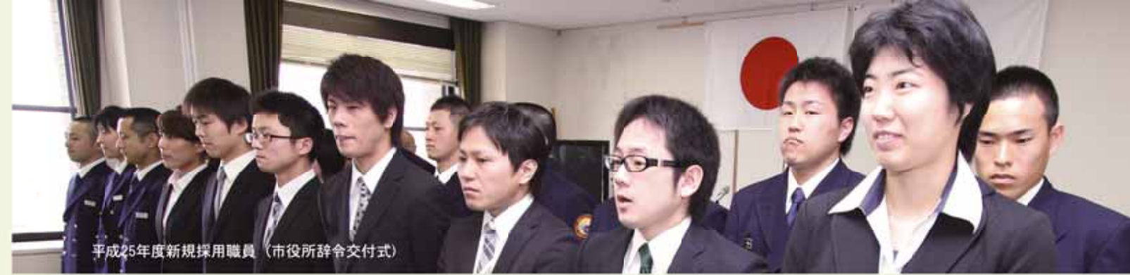
平成25年度新規採用職員（市役所辞令交付式）

住み良いまちづくりのため、市民と共に。 やる気と情熱を持ったあなたの力が必要です。