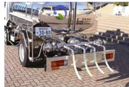
後方4箇所からの給水が可能です