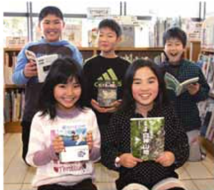
4月の開館が待ち遠しいな！

相良庁舎1階の出納窓口へ *夜間は、警備員室窓口へ 耐震補強工事に合わせてエレベーターも設置され、お年寄りや車椅子の方も利用しやすくなりま