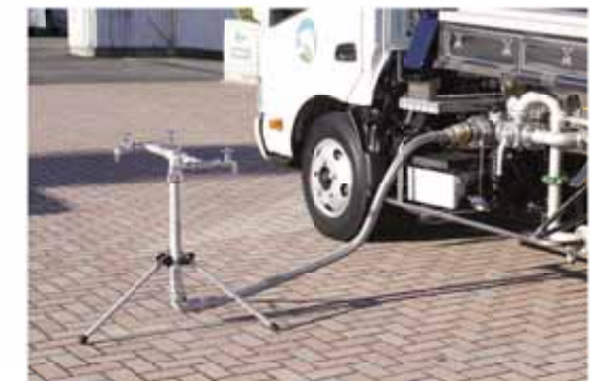
給水スタンドを連結できます