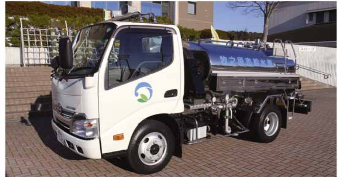
断水などの緊急時には、飲料水を積んで出動します

加圧ポンプを装備した給水車で、公共施設や病院などに設置された受水槽への補給や災害時の応急給水用のポリタンク、給水バックへの給水も短時間に効率的に行うことができます。 今回配備した給水車は、一度に2,000リットルの水を運ぶことができます。非常時に、1人が1日に必要とされる飲料水が最低3リットルといわれているので、約660人分に相当します。