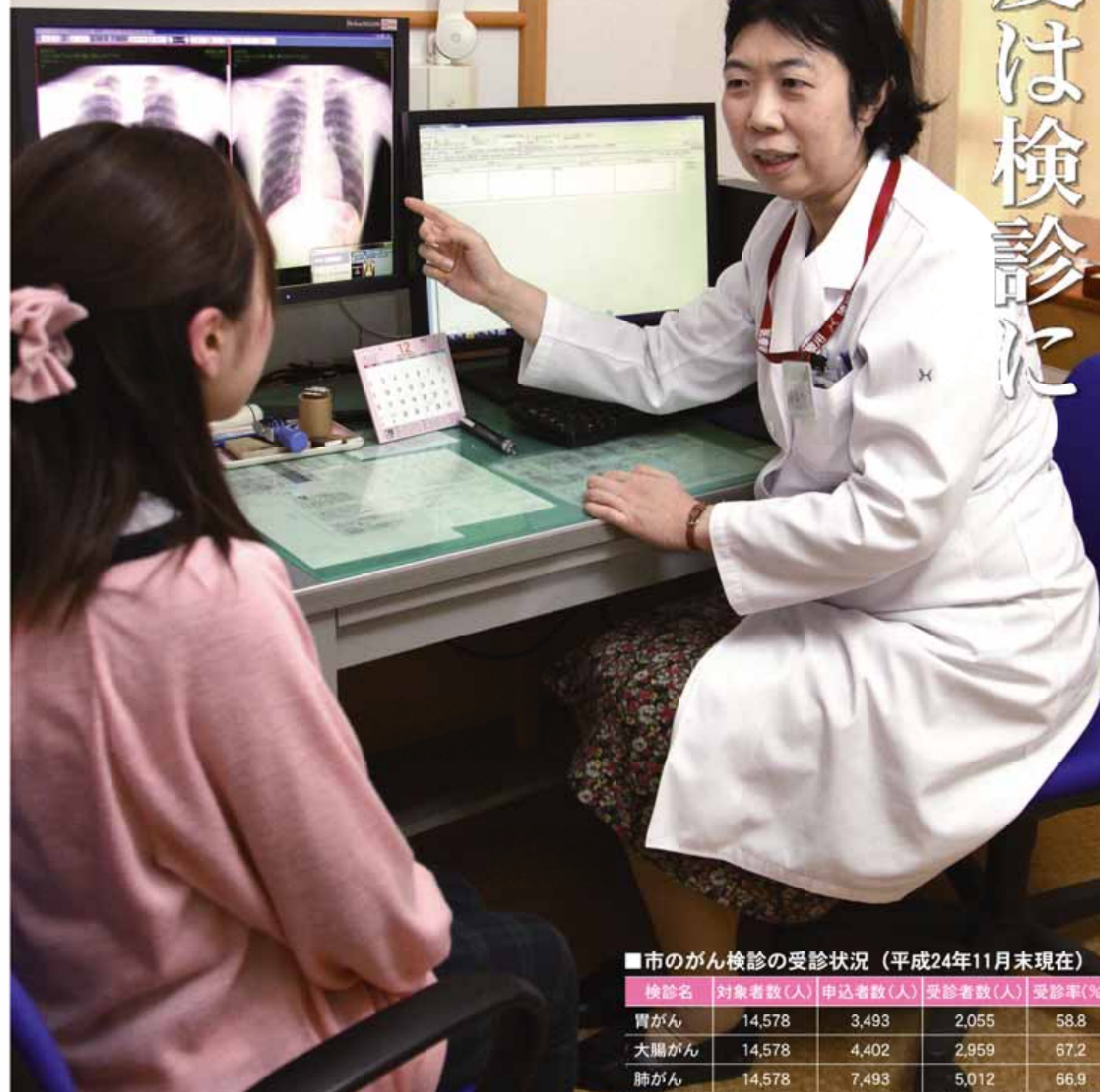
■市のがん検診の受診状況(平成24年11月末現在)