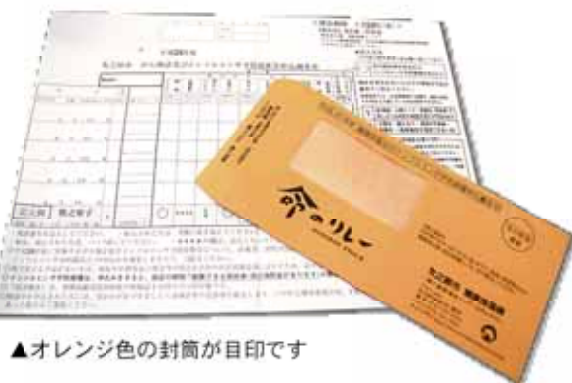
▲オレンジ色の封筒が目印です

検診による早期発見が大切 市の平成24年度のがん検診の受診状況は、6ページの表のとおり、申込者の60%程度しか検診を受けていません。日本人の死亡原因の第1位はがん、国の統計によれば、3人に1人はがんで亡くなっていることになりました。しかし、がんを発病しても現代の医学では、早期発見であれば完治させることが可能です。がんであつたや家族の大切な命を失わないためにも、年に1回のがん検診をぜひ受けてください。