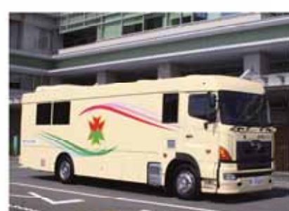
新しい検診用バス

新しい検診用バスが稼働 今年度、徳洲会グループから納車された検診用バスが稼働しています。