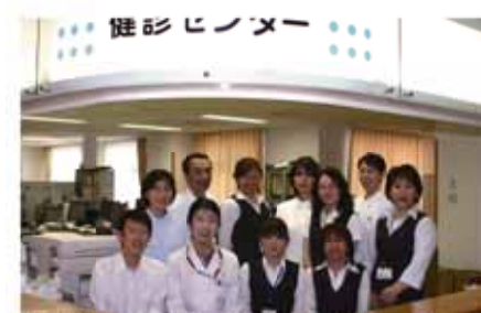
健診センタースタッフ(前列左から2人目が稲邊センター長。右端が大村係長)