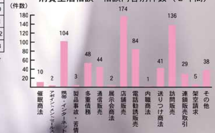
消費生活相談 相談内容別件数（2年間）