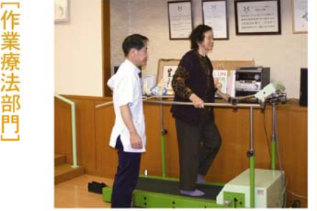
トレッドミルによる歩行訓練

は、当たり前のように聞かれていた患者さんの叫び声も、今ではなくなりました。毎日、患者さんとスタッフが楽しく談笑しながら、和気あいあいと訓練を進めている風景が見られます。