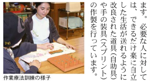
作業療法訓練の様子

訪問リハビリ部門 通院が困難な人のために、私たちスタッフが各家庭を訪問して行うのが「訪問リハビリ」です。