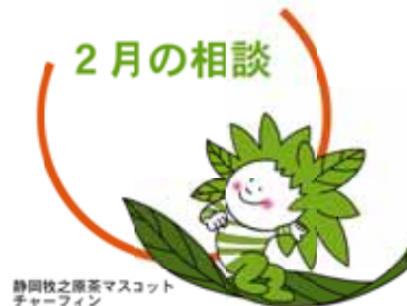
静岡県立総合医療センター チャームライン

2月の相談日です。 日々の生活の中で、誰かに相談したいと思っ ていることや疑問に感じていることはありませんか。 そんなあなたからの声に応えるための各種無料相談窓口 を紹介しします。 秘密は厳守されますので、一人で解決しようとせず、ま ずは相談してみたいかがですか。