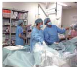
心臓カテーテル検査 (中央左が 臨床工学技士、中央右が医師)