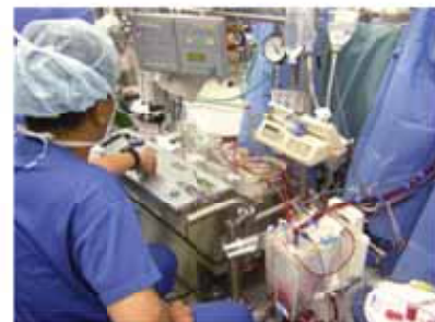
人工心肺装置の操作

手術開始前の麻酔器の 点検、心臓外科の手術で 人工心肺装置の操作など を行っています。