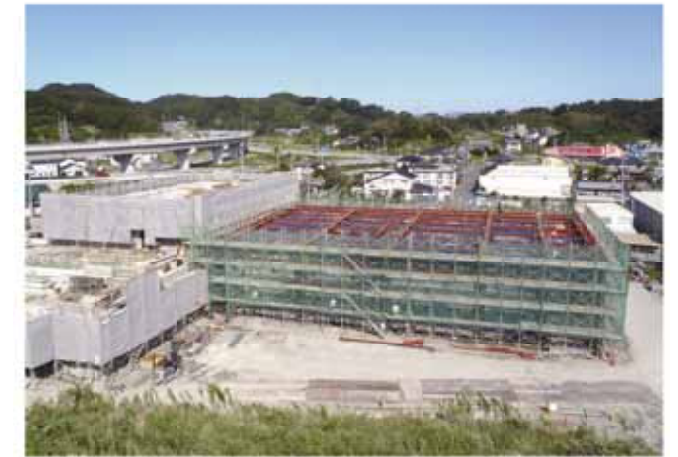
建設が進む消防本部庁舎。9月末現在の工事進捗率は約45%

平成23年度から御前崎市消防本部に委託していた相良地域の消防救急業務を、25年4月1日から新設される牧之原市相良消防本部で行います。 本部庁舎の建設は、今年12月末の完成に向けて予定通り工事が進んでいます。