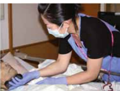
患者さんのひげそりをお手伝い

細くなった血管に風船や ステントと呼ばれる金属 の管を入れて血管を広げ る治療)が実施されます。 治療後は当病棟のCC U(集中治療室)に入院 していただき、CCU看 護師が看護を行っていま す。経過観察をしながら 心臓リハビリ、生活指導 を実施し退院へと導いて います。