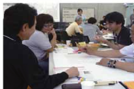
市民と協働してまちづくりを進めます