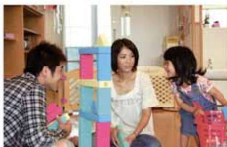
子どもを安心して生み育てられるまちに