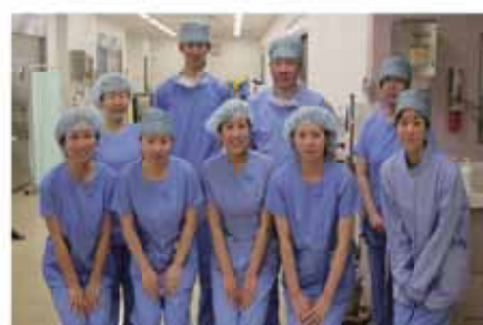
手術室スタッフ 前列左4名は手術室1日研修の新人看護師

「術前訪問」では手術前に病室 へ訪問し手術室入室時のオリエ ンテーション(患者確認・部位 確認)や、麻酔をかける際の体 位の説明などを実施しています。 手術内容・患者さんの情報収集 を行い、カンファレンスでチー ム内の情報を共有化すること で病棟に比べ患者様と関わる時 間が短い手術室において看護の 実践に取り組みしています。手術 後には患者さんを訪問し、手術 時に関わった事、大変だった 事がなかったかなど患者さん のお話を傾聴するとともに手術 に臨まれた患者さんを労うなど 「術後訪問」も実施しています。 手術室では手術の時だけでなく 手術前から手術中、手術後を 通して患者さんに関わらせてい ただくことでスタッフ全員がよ り良い手術看護を提供できるよ うに取り組んでいます。