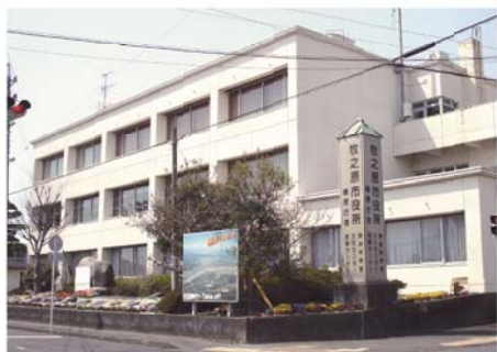
榛原文化センター会館棟

24年度に榛原文化センターの会館棟の耐震工事を実施するにあたり、耐震補強計画の策定と実施設計を行います。