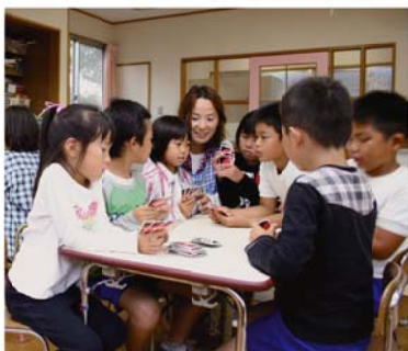
静波放課後児童クラブの子どもたち

不妊治療を受けた夫婦に対して、経済的な負担を軽減するため、治療に要した費用の一部を助成します。