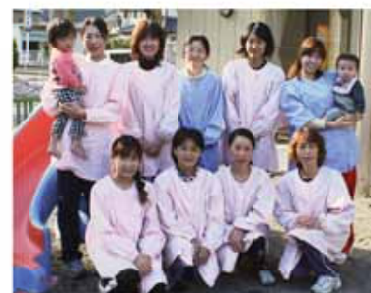
子どもが大好きな9人の保育スタッフ

スタッフ ▼保育士8人 保育助手1人の 合計9人 子どもが大好きな、若い20 代から熟年50代までの幅広い 年齢層で、保育しています。 現在の保育人数は、0才児9 人、1才児12人、2才児4人の 合計25人。パワーと優しさ、そ して時に厳しさをもち、お母 さんのように接していきけるよ うにがんばっています。 おおよそ保育所は、職員が安 心して仕事に従事できるよう に、主に看護師のお子さんを保 育する院内保育所です。対象は 0・1・2才児(産休明けから 保育園、幼稚園の年少組入園ま で)です。 また、臨時保育として小学生 以下のお子さんを土日や学校 の長期休暇時に受け入れたり、 保育園や幼稚園が終わってか ら母親の仕事が終わるまでの 間の保育も行っています。