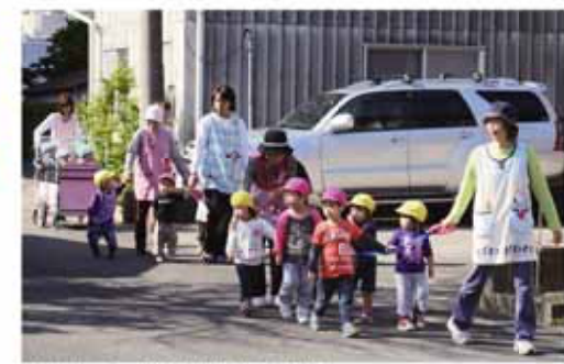
みんなで一緒に仲良くお散歩