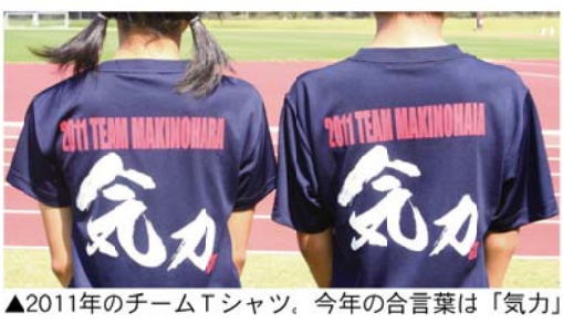
▲2011年のチームTシャツ。今年の合言葉は「気力」