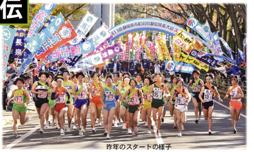
昨年のスタートの様子

12月3日に開催される「しずおか市町対抗駅伝」に出場する本市の代表選手が決定しました。今年も、県庁前から草薙陸上競技場までの11区間、42.195キロを選手たちが熱い思いを込めて駆け抜けます。 昨年は「2時間25分55秒・市の部19位」とタイム・順位共に過去最高の成績を収めた牧之原市チーム。今年も記録の更新を目指して、選手たちは練習に励んできました。苦しいときに選手の気力を奮い立たせてくれるのは、皆さんの応援です。郷土の誇りをかけてたすきをつなぐ選手たちに、熱い声援をお願いします。