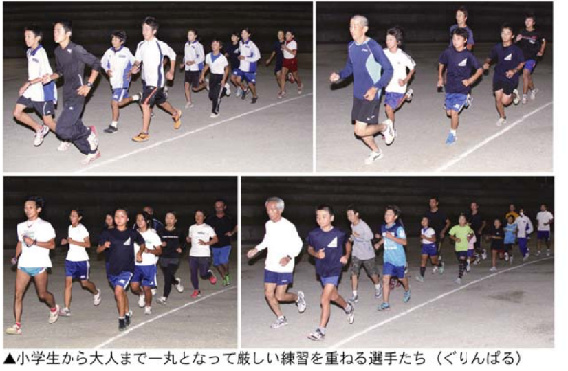
▲小学生から大人まで一丸となって厳しい練習を重ねる選手たち(ぐりんぱる)

放送案内 ◆SBSテレビ 9:30~12:50 ◆SBSラジオ 9:45~13:00