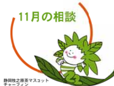
静岡県之原茶マスコット チャーマイン

11月の相談日です。 日々の生活の中で、誰かに相談したいと思っ ていることや疑問に感じていることはありませんか。 そんなあなたからの声に応えるための各種無料相談窓口 を紹介しします。 秘密は厳守されますので、一人で解決しようとせず、ま ずは相談してみてもいいかがですか。