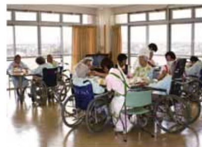
ホールでの食事介助の様子

看 護補助者も病棟経験 の豊かな者から老健施設 やデイサービスなど介護 施設の経験の豊かな者と 介護に情熱を持ったメン バーが集まっています。 安心な療養生活を提供 療養病棟には、日常生 活行動が自立している方 一部介助が必要な方、寝 たきりで全介助が必要な 方などさまざまな状態の 患者さんが入院してきま す。中には呼吸器を装着 している方、輸液管理が 必要な方、注入食施行を されている方、看取りの 方など看護、介助の必要 度が高い方もいます。そ のような患者さんが日々 安心して療養生活ができ るよう病棟スタッフだけ でなく、他職種の支援も もらいながら看護を行っ ております。