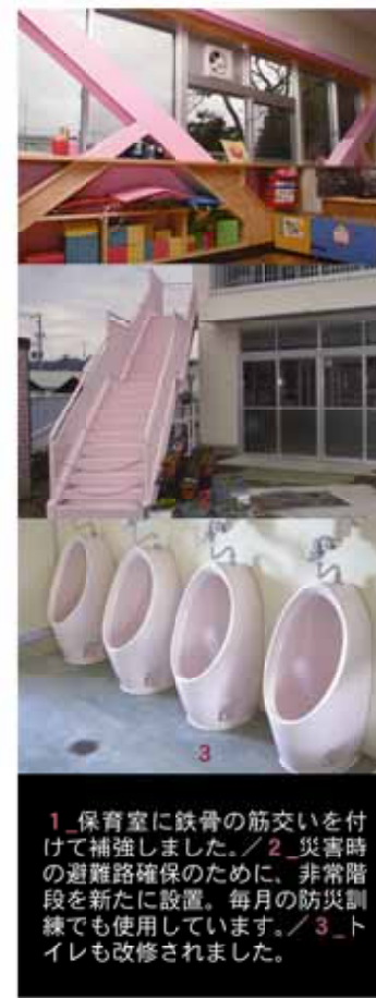
1 保育室に鉄骨の筋交いを付けて補強しました。/ 2 災害時の避難路確保のために、非常階段を新たに設置。毎月の防災訓練でも使用しています。/ 3 トイレも改修されました。