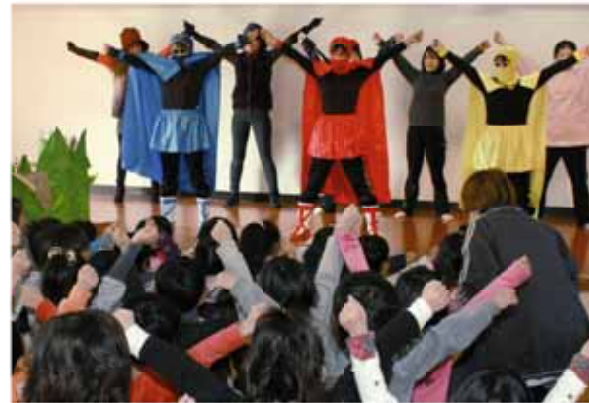
↑防犯訓練後、防犯レンジャーと一緒にダンシング。

訓練後の保育園では、園児が歌を口ずさみ、ごっこ遊びをするなど、防犯意識が高まっていました。