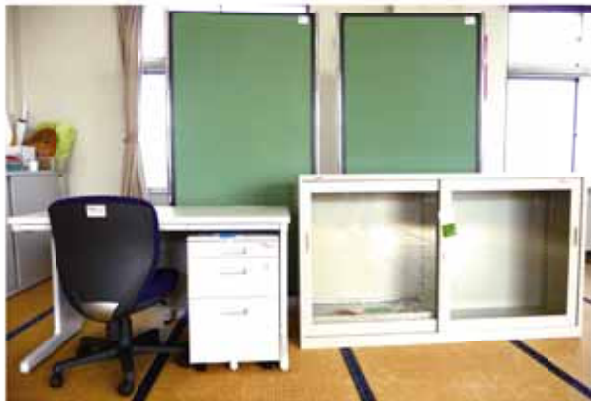
↑宝くじ助成により整備された須々木区民館の備品。

▶整備した備品/会議室などのテーブルとイス、書庫/ノートパソコン/プロジェクター/スクリーン/プリンタ