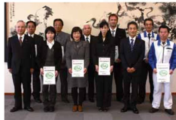
↑今回、エコアクション21の認証を受けた8事業所の皆さん。