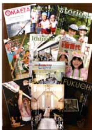
左上から、御前崎市、菊川市、川根本町、岩手県遠野市、岩手県一戸町、福島県猪苗代町、千葉県芝山町、石川県能登町、岩手県盛岡市、福岡県糟粕川町。

隣の写真は、わたしがいつも参考にし、目指している広報紙の一部です。いずれも表紙だけでなく内容が素晴らしいものです。いつか同じレベルになれるよう、そして何よりも皆さんに読んでもらえるよう努力します。