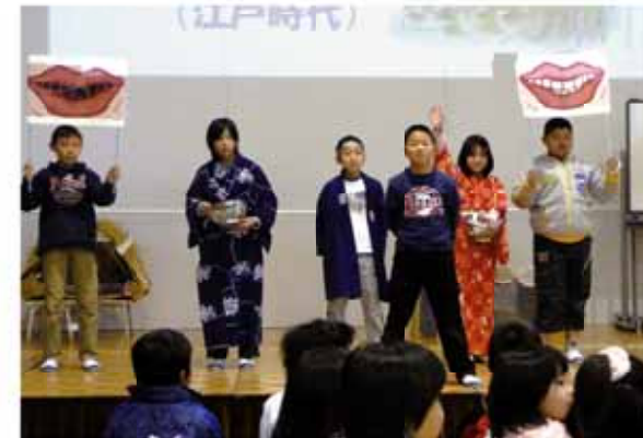
↑クイズを入れるなどして、みんなで協力し劇をする児童ら。

劇やパソコンなどで発表を行った児童生徒からは、「男女関係なく、差別なく一緒にやっていくことが大切」などといった感想が述べられました。