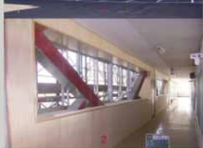
1 耐震化が完了した牧之原中学校。/ 2 鉄骨の筋交いで補強をした牧之原中学校の校舎。