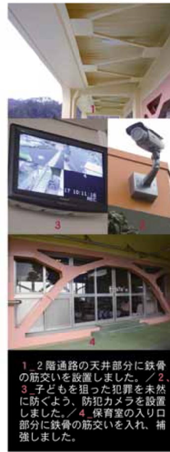
1 2階通路の天井部分に鉄骨の筋交いを設置しました。/ 2、3 子どもを狙った犯罪を未然に防ぐよう、防犯カメラを設置しました。/ 4 保育室の入り口部分に鉄骨の筋交いを入れ、補強しました。