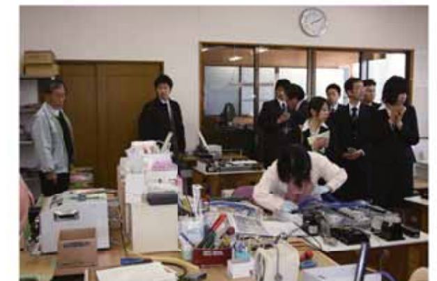
↑市内企業の職場を見学する参加者。