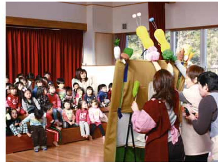
↑食育について、人形を使い園児に楽しく指導する同園保育士。

▶今回取得した事業所/双和プラスチック工業㈱/藤友製作所/藤さつき自動車/株東遠洋浄化槽管理センター/株神谷鉄工所/株東環クリーン/共和建設㈱/株原工機㈱