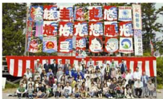
↑ 健やかな成長を願い、参加者全員で記念撮影

わたしたちが住むこの地域には、徳川中期のころから、初の男子誕生を祝って、端午の節句に相良凧をあげる風習があります。 これに倣って、市観光協会では毎年、さがら凧あげ大会を開催しています。 大会には、初節句以外の人も