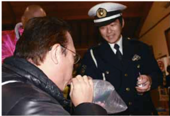
↑実際に飲酒し、警察官による飲酒検知を体験。