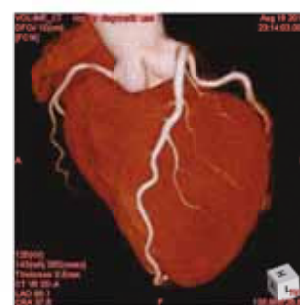
心臓と冠動脈(320列CTで撮影)

診療の特徴 「320列CT」 カテーテルを体に入れるこ ともなく、さらに入院をする こともなく、1秒以内で正確 に冠動脈の状態を評価できる 最新の医療機器です。 狭心症や心筋梗塞は、7年 間で約2割の人が再発する といわれています。1、2年に 一度は320列CTでの心臓 検査をお勧めします。 また糖尿病の人、コレステ ロール値が高い人、胸がドキ ドキしたり、切なくなる人は CT検査を受けましょう。 特に糖尿病の人では、やは り7年間で2割ほど、冠動脈 が詰まるといわれています。 糖尿病は、心臓の危険な状態 を知らせる自覚症状が、神経 が障害されて出にくくなるの で、定期的な心臓健診が重要 となります。