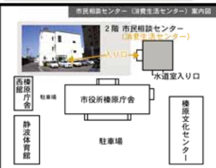
*職員や来庁者など、他人に会うことなく入ることができます

期日 10月15日(金) 時間 13:30～16:00 会場 棟原庁舎2階相談室 ☎包括支援センターオーリーブ ☎08822