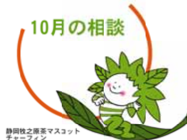
静岡県産茶マスコット チャーフィン

10月の相談日です。 日々の生活の中で、誰かに相談したいと思っ たり疑問に感じていることはありませんか。 そんなあなたからの声に応えるための各種無料相談窓口 を紹介しします。 秘密は厳守されますので、一人で解決しようとせず、ま ずは相談してみたいかがですか。