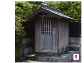
国道473号バイパス大沢ICから北へ200メートルほどの茶畑の中腹には、園村常夜燈があります。

園坂を上ると、馬頭観音を祭る須々木原観音堂（須々木）があります。信州街道が今の相良・掛川往還と合流した三差路にあたり、ここにも塩の道モノユメントが建てられています。