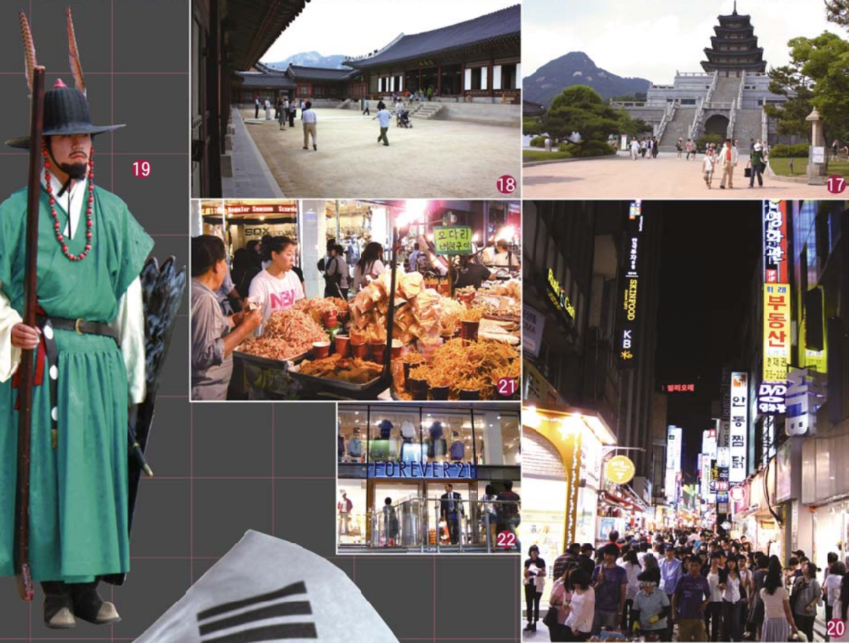
141516清溪川(チョンゲチョン)はソウル中心部の光化門の「清溪広場」を基点とする全長5.8km。ソウル市民の憩いの場となっています。 17国立民俗博物館。 18韓国を代表する故宮の一つである景福宮(写真は王妃の寝室である「交泰殿」)。景福宮は、1395年李氏朝鮮時代の正宮で、現在復元工事中。2035年に完了予定です。 19朝鮮時代守門交代儀式が行われています。 20ソウルを代表する繁華街の一つ「明洞(ミョンドン)」。 21明洞には、さまざまな屋台が立ち並び、活気に溢れています。 22最新のファッションブランドも多く、若者でにぎわっています。