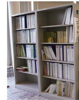
相良庁舎1階ロビー情報公開コーナー

情報公開コーナーで「個人情報取扱事務登録簿」を閲覧できます 個人情報を取り扱う市の事務を「個人情報取扱事務登録簿」へ登録しています。 この登録簿は、情報公開コーナー（榛原庁舎2階市民ラウンジ、相良庁舎1階ロビー）で誰でも閲覧することができます。