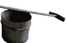
エブリ(上)とカケオケ