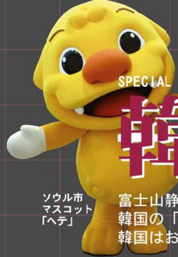
ソウル市 マスコット 「ヘテ」