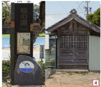
須々木原観音堂。ここには馬頭観音菩薩が祭られています。