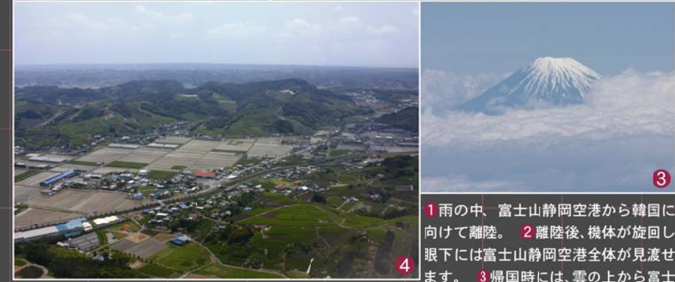
1雨の中、富士山静岡空港から韓国に向けて離陸。2離陸後、機体が旋回し、眼下には富士山静岡空港全体が見渡せます。3帰国時には、雲の上から富士山が綺麗に見えます。4もうすぐ着陸。地元坂部の風景が広がります。