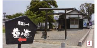
小田宮神社には塩の道の案内看板が設置されています。

秋葉神社は、「火の幸を恵み、悪火を鎮め、火を司り給う神様」として信仰され、参拝に向かう道は秋葉街道と呼ばれています。