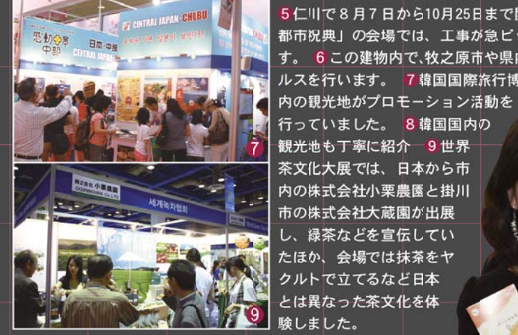
5仁川で8月7日から10月25日まで開催される「仁川国際都市祝典」の会場では、工事が急ピッチで進められています。6この建物内で、牧之原市や県内の市町がシティセールスを行います。7韓国国際旅行博覧会会場では、日本国内の観光地がプロモーション活動を行っています。8韓国国内の観光地も丁寧に紹介。9世界茶文化大展では、日本から市内の株式会社小栗農園と掛川市の株式会社大蔵園が出展し、緑茶などを宣伝していたほか、会場では抹茶をヤクルトで立てるなど日本とは異なった茶文化を体験しました。