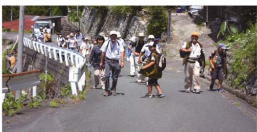
昨年、生涯学習推進ボランティア「スマイル」の協力で実施した「まきのはら☆子ども教室」による塩の道ウォーク。歩いた区間は、浜松市天竜区佐久間町の一部。この区間はかなりの斜面で、当時のままに民家の間を通る塩の道が残っています。