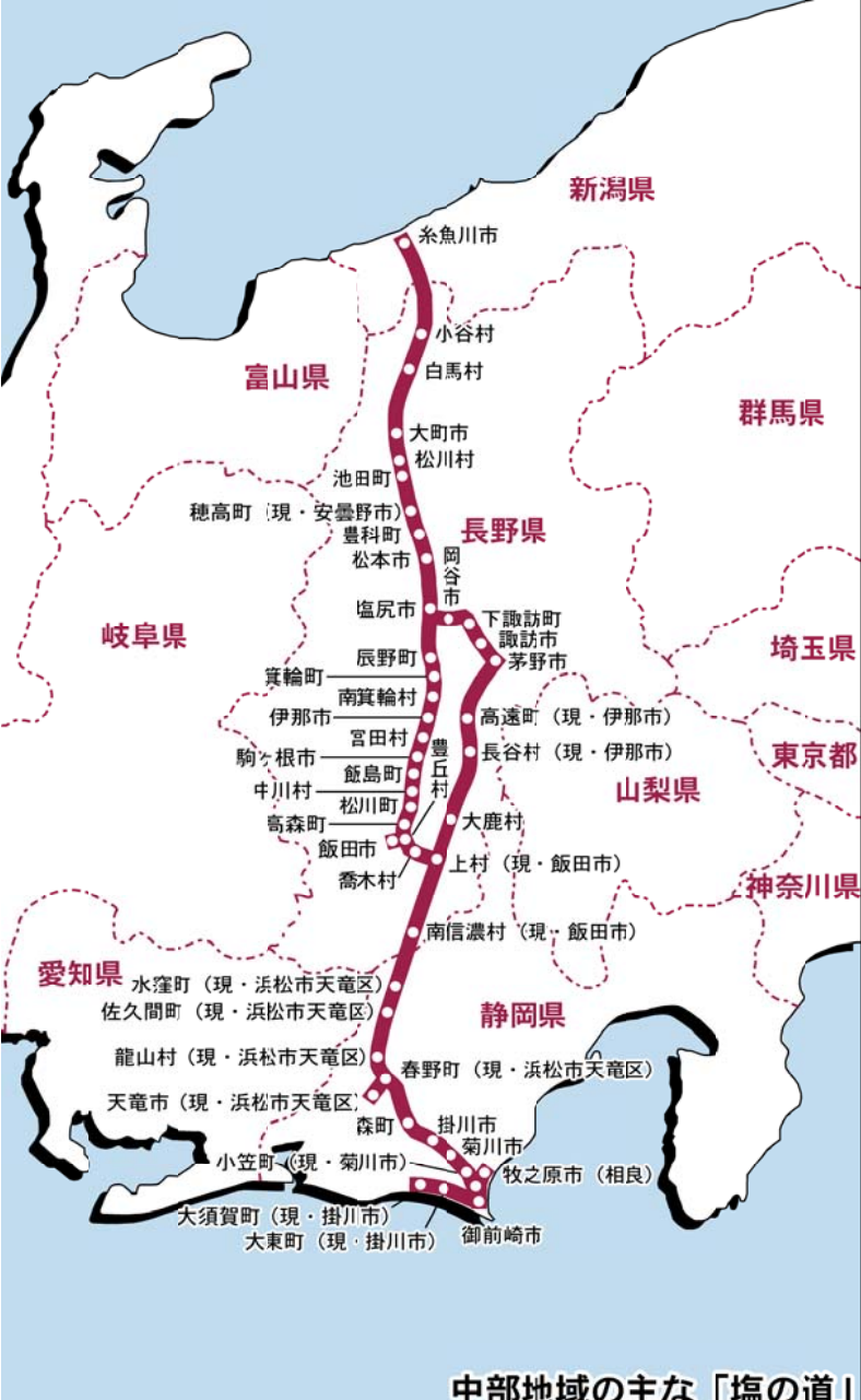
中部地域の主な「塩の道」