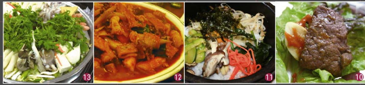
10焼肉 11石焼ビビンバ 12トッポキ 13海鮮鍋 韓国の(ツアーの)食事は美味しく、日本人の口に合います。ただ、地元の方がよく行くお店のメニューは、とても辛いです。付け合せのキムチなどは、おかわり自由。「キムチください」は韓国語で「キムチチュセヨ」です。