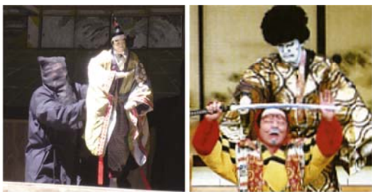
長野県下伊那郡大鹿村の国選無形民俗文化財「大鹿歌舞伎」(右上) 長野県飯田市の国選無形民俗文化財「黒田人形浄瑠璃」(左上) 森町の国指定重要無形民俗文化財「天宮神社十二段舞楽」(右下)

市民の皆さんも「塩」の文化をあらためて見直し、この機会に、郷土の歴史、文化に触れてみませんか。