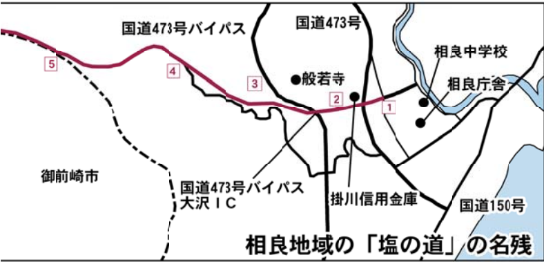
相良地域の「塩の道」の名残