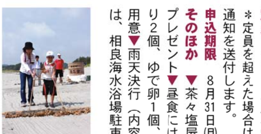
昨年、行われた塩づくりの様子。写真の道具は「ソロ」と呼ばれるものです。これは、2回目の塩かけのために整地をし、この後の砂を集め、本格的な塩づくりに突入していきます。