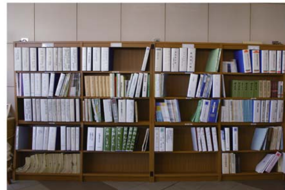
榛原庁舎2階の市民ラウンジ情報公開コーナー

●牧之原市情報公開審査会・個人情報審査会の開催状況 情報公開審査会および個人情報審査会の開催はありませんでした。