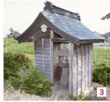
般若寺の裏山にある園村の常夜燈。