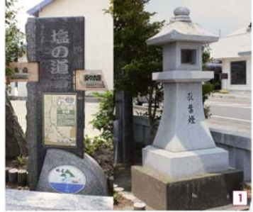
波津にある大原の常夜燈。ここから塩の道と秋葉街道が始まります。

海のない信州地方にとつて、相良などから塩は貴重なもので、その運搬経路を塩の道と言いました。