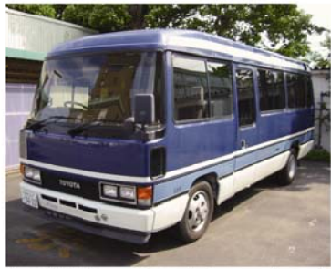
申込期間中、榛原庁舎にて車両を公開しています。

マイクロスバスを、制限付き一般入札で売却します 入札番号 第413号 入札物品 ▼ 車種・台数・トヨタ コースター U-HD B31 1台 ▼ 走行距離15万4745キロ ▼ 車検有効期限平成21年12月11日 予定期間 20万円 申込期間 6月22日(月)～7月3日(金) 附帯条件 ▼ 引き渡しは現状渡し。▼ 車両の運送および名義変更手続きは落札者負担。▼ 税金を滞納している方、未成年の方、成年被後見人、被保佐人、破産者で復権を得ない方、暴力団およびその関係者は入札に参加できません。* 申込方法など、詳しくはホームページをご覧ください。 問い合わせ 管財契約室 小林 ☎(23) 0055 http://www.city.makinoharashizuoka.jp