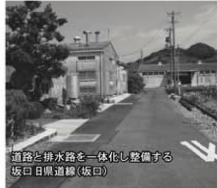
道路と排水路を一体化し整備する坂口旧県道線(坂口)