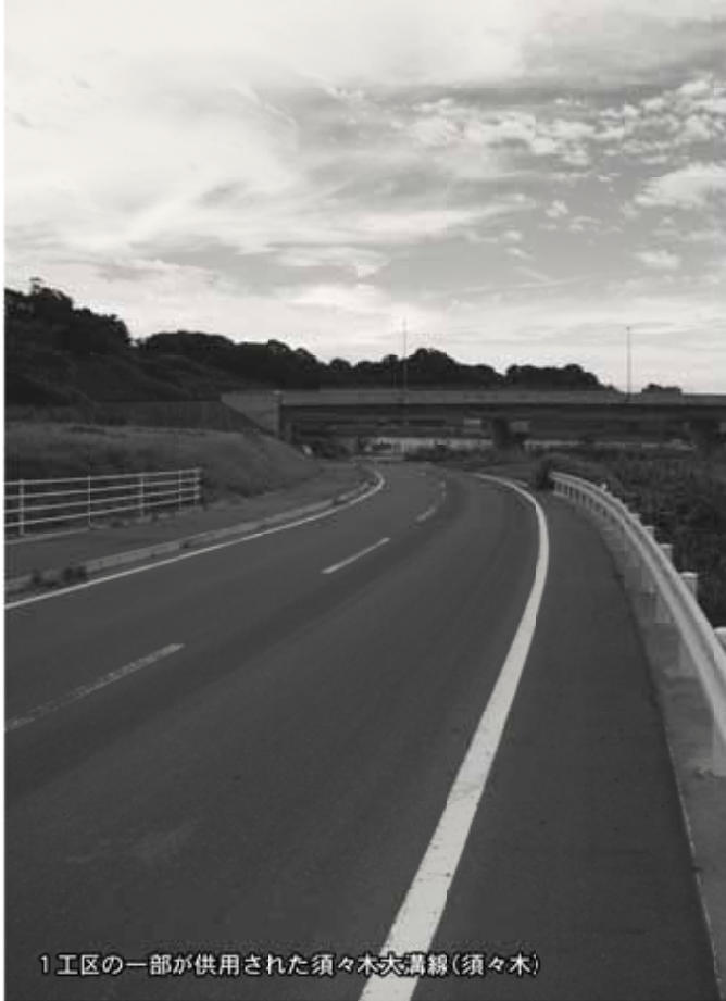
1工区の一部が供用された須々木大溝線(須々木)

また、スズキ物相良工場の増設に伴い、交通渋滞の緩和策として、「豊丁田北線」と「大