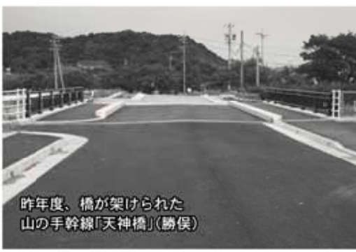
昨年度、橋が架けられた山の手幹線「天神橋」(勝俣)