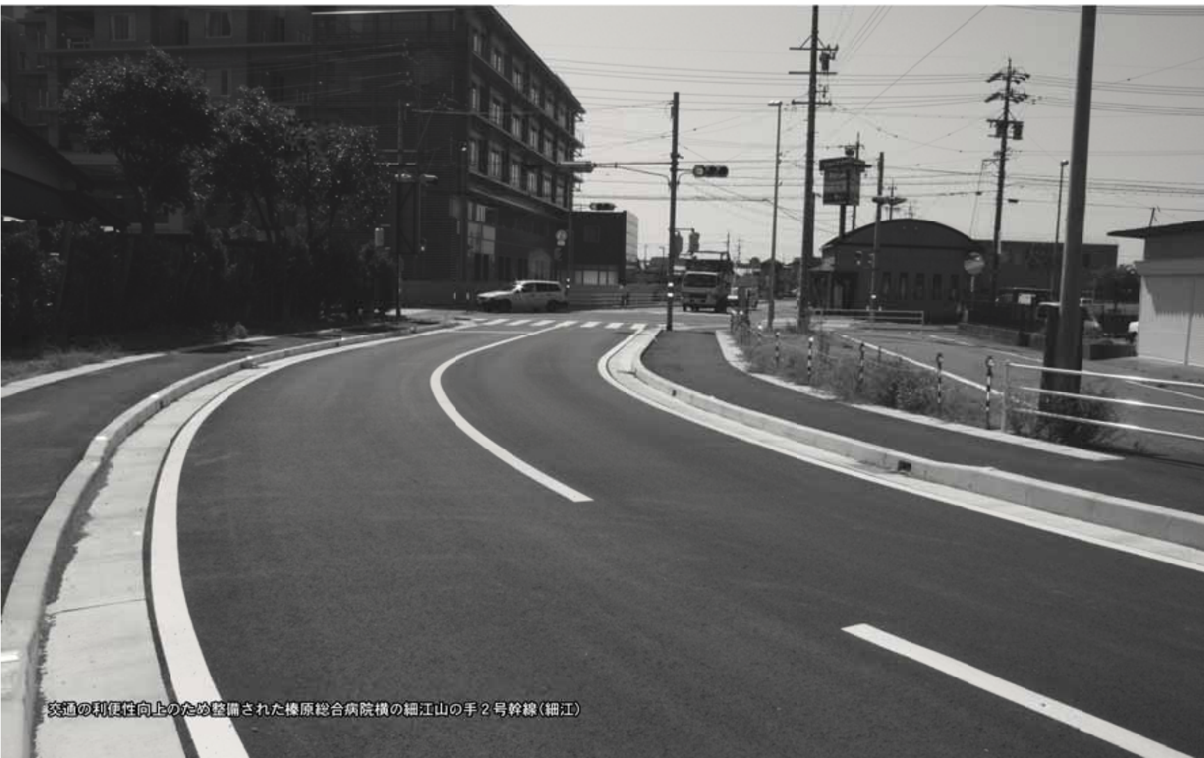
交通の利便性向上のため整備された榛原総合病院横の細江山の手2号幹線(細江)