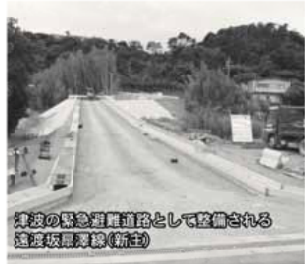
遠波の緊急避難道路として整備される遠波坂(新土)