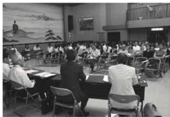
保護者など約200人が出席したシンポジウム