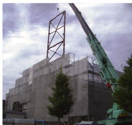
既存の建物に鉄骨の筋交いが組み込まれ、耐震補強が進みました

このように、資源の有効利用や建築廃材の抑制に努めることで、循環型社会の実現を目指す、環境にやさしい整備事業となりました。