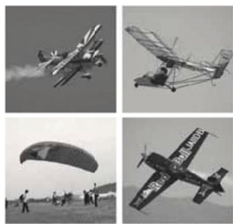
過去のスカイ・レジャー・ジャパンの様子

●期日 11月8日(土)・9日(日) ●時間 午前9時～午後4時 ●会場 富士山静岡空港建設地内 ●入場料 無料 ●アクセス 空港内に2500台分の駐車場を用意しています。満車の場合は、臨時駐車場(坂口工業団地内、機小系製作所様原工場、矢崎部品機機原工場)からの無料シャトルバスをご利用ください。 ●主催 スカイ・レジャー・ジャパン08 静岡実行委員会、静岡エアポートフェスタ実行委員会 *熱気球係留体験は、午前7時から午前9時まで、大井川緑地公園(JR島田駅から徒歩10分)にて体験できます。