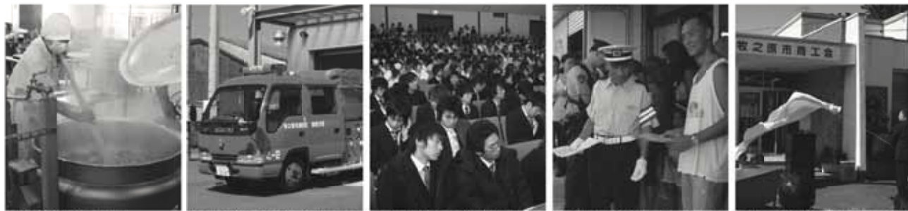
学校給食の民間委託 消防団分団の統廃合による 成人式の企画運営の見直し 交通安全指導員の人員および出動事業の見直し 相良町商工会と榛原町商工会の合併支援