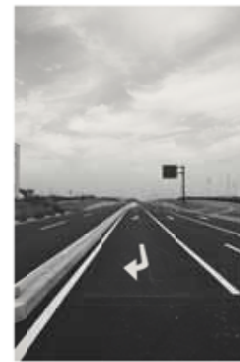
空港と国道473号を結ぶアクセス道路(島田市猪土居)

空港本体（滑走路・エプロン・誘導路など）の工事を完了し、国土交通省による完成検査が実施されています。また、空港旅客ターミナルビルを含めた駐車場やアクセス道路などの周辺部の整備は、現在、急ピッチで工事が進められています。