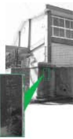
地頭方体育館は、旧地頭方中学校の体育館として昭和42年に完成。昭和45年には御前崎中学校地頭方分校となり、昭和47年に現在の御前崎中学校が新設されるまで学校の体育館として使用され、現在はスポーツ施設として使用されています。今でも校門など当時の面影を残しています