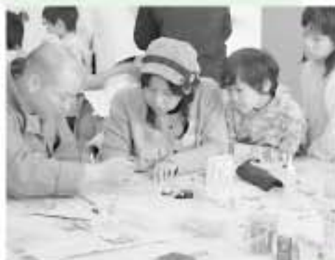
純銀アクセサリ教室で、ペンダント作りを体験する来場者

昨年4月から今年1月まで、絵画や陶芸、編み物、生け花など、75講座に市民51160人が集い学習した「はりはら塾」の学習成果発表会が、2月10日、11日に榛原文化センターで開催されました。会場には、塾生の作品が所狭しと展示され、約1500人の来場者を感じさせたほか、さまざまな体験教室も行われました。このうち、純銀アクセサリ教室では、講師の手ほどきを受けながら、来場者が気軽にペンダント作りなどを体験しました。