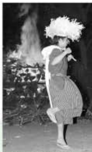
厳かに舞を奉納する若者

市内蛭ヶ谷の蛭見神社に伝わる「蛭ヶ谷の田遊び」が、2月11日夜に同神社境内で行われました。この神事は、一年の豊作と子孫繁栄を願って鎌倉時代から始まったとされ、鳴り物を一切使わず、せりふと舞だけで表現されるのが特徴。地域的特性などから、現在、国の文化審議会から「記録保存すべき文化財」に指定されており、今後は国の重要無形文化財となる可能性があります。神事では、カガリ火がたかれる厳かな雰囲気の中、地元若者らが細長く切った和紙を束ねて作った紙笠を頭にかけ、「田打ち」などの呪術舞を夜遅くまで繰り広げました。