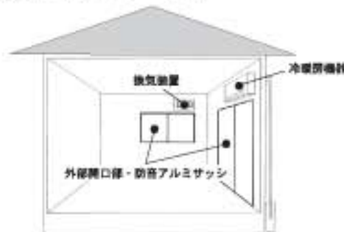
■住宅防音工事のイメージ図

富士山静岡空港では、航空機騒音の影響が及び地域に対してこれらの対策のほか、集会場などの共同利用施設の整備や畜産物などへの影響対策も実施していきます。