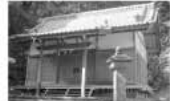
祇園春日神社は、古くから落居村の産土神でした。同神社の創立年代は不明ですが、明治維新以前は牛頭天王、春日大明神と称し、通称「山の神」と呼ばれていました

【地頭方】 鎌倉時代、相良荘・新荘の地頭方の得分地(所領地)に由来する地名。 【落居】 丘陵地域から清水が落ちるところを、共同井戸のごとく里人が飲料水としたことから「落井」または「落合」から由来しているという説がある。