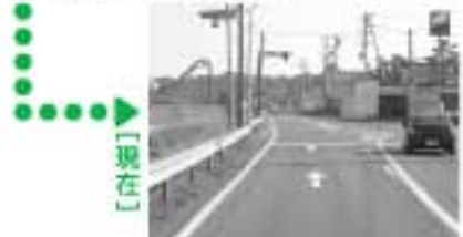
[写真上] 当時は防波堤が未整備で、さらに道路が未舗装だったため、雨上がりにはわだちがくっきりと残っていました。 [写真下] 昭和40年に舗装工事が完了。現在、さらなる高潮対策工事が進められています。

建造したものを、天和2年(1682年)に現在地へ移築したものです。 この建築様式は、室町時代の様式といわれ、柱の面が広いことや、海老紅染の錫杖彫、柱股などに特徴があります。