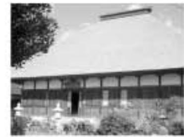
市指定文化財「約月院本堂」 約月院は、応仁2年(1468年)の開創と伝えられ、今の本堂は桃山時代の天正17年(1589年)に

建造したものを、天和2年(1682年)に現在地へ移築したものです。 この建築様式は、室町時代の様式といわれ、柱の面が広いことや、海老紅染の錫杖彫、柱股などに特徴があります。