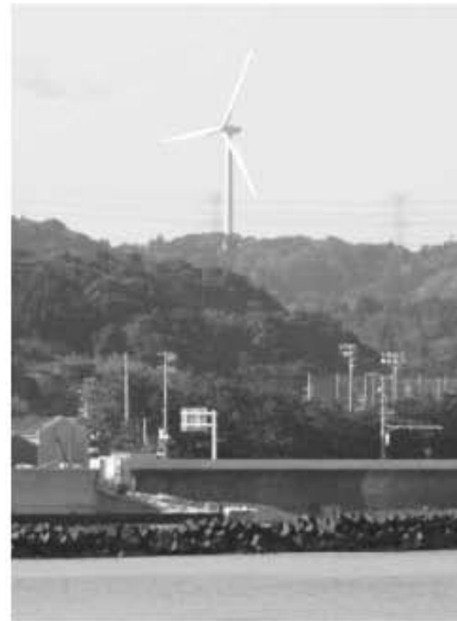
落居地区には市内で初めての風力発電施設があり、高台を吹き抜ける風を受けながら、風車が力強く回って発電しています

毎月5日号では、市内各地区の名所や旧跡、見所などを紹介しています。 相良地域の住民は榛原地域を、榛原地域の住民は相良地域を知り、牧之原市民が融合して、この郷土を「わがふるさと」と感じられるようになったら素敵ですね。 今回は、地頭方・落居地区を紹介します。