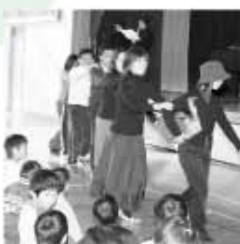
寸劇を交えながら、児童に朗読劇を披露する「ひまわり」のメンバーら

菅山小学校に通う児童の母親有志で作る絵本の朗読劇サークル「ひまわり」が、2月7日に「全校読み聞かせの会」を開きました。「ひまわり」は、子どもたちに本の楽しさを知ってもらおうと4年前に結成。現在はメンバー16人で活動しており、家事の合間に練習や小道具の製作などを行い、同校で年2回、この会を開いています。この日は、「ひまわり」のメンバーのほか同校教員も加わり、寸劇を交えて童話「金のがちょう」を披露すると、全校児童159人は、時折、大きな笑い声を上げながらも、夢中でお話に入っていました。