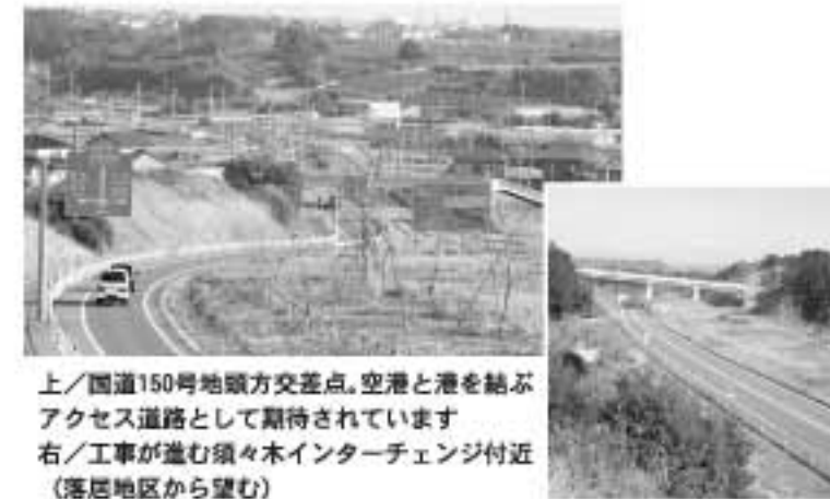
上/国道150号地頭方交差点。空港と港を結ぶアクセス道路として期待されています 右/工事が進む須々木インターチェンジ付近(落居地区から望む)

この発電施設は、民間企業が設置したもので、高さ約1000m、羽根部分の大きさは直径70m、一般家庭900世帯分の消費電力に相当する年間約300万kWhの発電能力があります。 この地域は、駿河湾と遠州灘を間近に望む高台の地形で、一年を通して風が強く、特に冬には常に強風が吹くことから、この施設が作られました。 再生可能なエネルギーの一つである風力エネルギーを使っての発電は、地球環境の保全にも役立ち、この発電施設は年間約1000トンの二酸化炭素削減効果があるそうです。