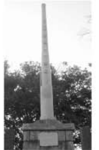
市指定文化財「表忠塔」 明治維新以来、地頭方地区出身の戦没者244柱の霊を祭る鎮靈神社の境内に、明治の軍艦「秋津洲」の砲身で作られた記念塔「表忠塔」があります。 高さは約5mあり、塔身には名和海軍中將書「尽忠戦士之榮塔」の文字が刻まれています。また、台石の左側の銅板に「大砲経歴」の銘文があります。