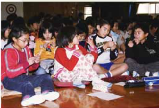
たばこによる健康被害を模擬体験する児童

たばこの害から子どもたちを守るべく、12月18日に川崎小学校で5年生と6年生、保護者を対象とした喫煙防止教室を開きました。