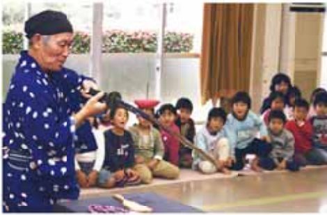
こまの曲芸に夢中になる園児たち

12月14日に菅山農就センターで、菅山保育園と萩間保育園の4歳児・5歳児72人とこまの曲芸師との交流会「こまのおっちゃんと遊ぼう」が開かれました。