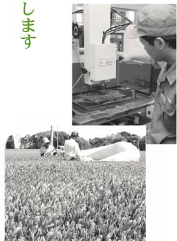
市内の農業と工業が、相乗効果によって共に発展する「農工両善」を進めます

よっぽど引き締めていかないと大変だと言うことがはつきりしてきました。一刻の猶予もなく、新しい牧之原市づくりを計画的に始めなければなりません。一方、うれしい話題もあります。にぎわいを見せる御前崎港や整備が進む国道150号や国道473号は、スズキをはじめ市内企業の発展に寄与しており、今後の雇用拡大や市の税収増に期待を膨らませてくれます。そして平成21年春開港の富士山静岡空港は、牧之原市の成長に貢献することでしよう。さらなる協働の推進、市民生活への細心の心配り、農工両善、広域連携の推進、環境政策の強化、牧之原教育の創造、そして市役所改革など、今年も多様な展開で幸福実現都市を目指してまいります。