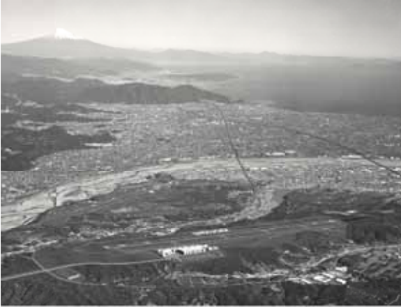
平成21年春開港の富士山静岡空港の完成で、市内の地域産業構造が大きく変わろうとしています(写真は完成イメージ)