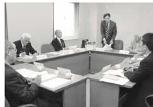
懇談会では、さまざまな面から、牧之原市の行政改革について検証や協議を行います

—市民が市政へ参画するためには、どんなことをすべきでしょうか。 「自分の意見を発言するということは勇気がいることです。しかし、発言をしなければ何も前進しません。社会情勢がめまぐるしく変わる大変な時代ですが、牧之原市が生き残るためにも積極的に議論をし、市民が団結しなければならぬと思います。ですから、市が進める『フォーラムまきのはら』には期待しています」