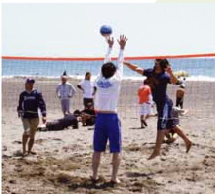
ビーチバレーでは熱戦が繰り広げられました

このうち、4日に行われたビーチバレー大会には市内外から15チームが参加。選手たちは、砂浜のコートで砂まみれになりながらボールを追いかけました。 マリニック開催期間中は、絶好の行楽日和に恵まれ、同地を訪れた約5000人は一足早い夏を感じていました。