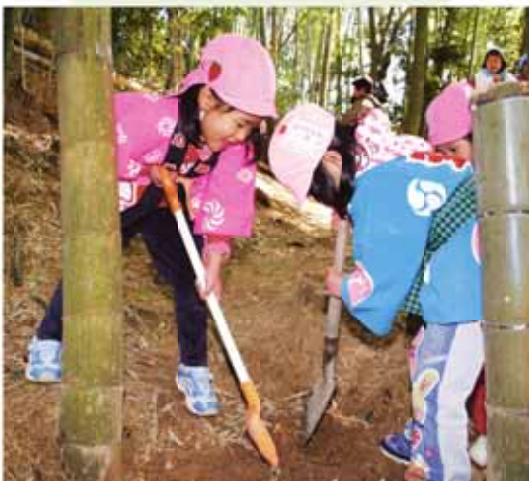
一生懸命こ竹の子掘りに挑戦する園児ら

当日は、園児ら50人がスコップを片手に竹林に入り、なかなか抜けない竹の子に挑戦苦闘しながら竹の子掘りに挑戦し、保護者会などの手助けを受けながら、約30本の竹の子を収穫しました。その後、園児は収穫した竹の子の皮をおいて釜茹でし、お昼の給食には、4、5歳児が中心となつて作った竹の器に、みそ田楽やおかか炒めなど竹の子料理8品を盛り、竹の子つくしの春の味覚を味わいました。