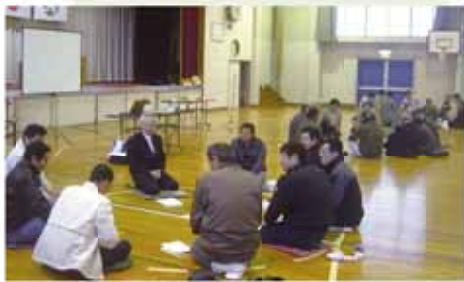
三つのグループに分かれ議論する参加者

参加者からは「観光面から富士山は魅力的なもののひとつ。富士山の見える景観づくりを」などと観光に関する意見が出されたほか、ごみ問題や公共交通機関の不足などについても意見が出され、その後、グループごとに発表を行いました。