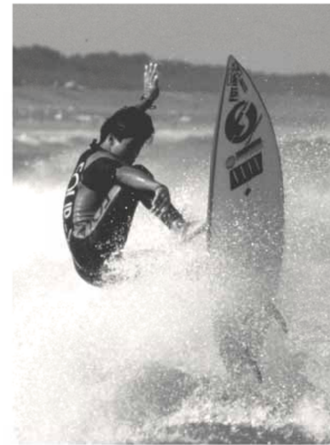
「静波」から連想するものの一つがサーフィン。県内外から多くの人々が訪れます

合併からおよそ4カ月。同じ市内なのに、まだまだ知らない事が多いと思います。そこで、毎月5日号では、市内各地区の名所や旧跡、見所などを紹介していきます。第2回は、県内最大規模を誇る静波海水浴場などで知られる静波地区をご紹介します。