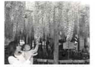
東光寺の長藤が見ごろとなる4月下旬から5月上旬には、「長藤まつり」が開かれます