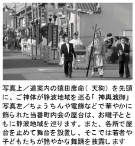
写真上/道案内の猿田彦命(天狗)を先頭に、ご神体が静波地域を巡る「神輿渡御」写真左/ちょうちんや電飾などで華やかに飾られた当番町内会の屋台は、お囃子とともに静波地域を巡ります。また、各所で屋台を止めて舞台を設置し、そこでは若者や子どもたちが艶やかな舞踊を披露します