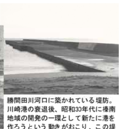
勝間田川河口に築かれている堤防。川崎港の衰退後、昭和30年代に榛南地域の開発の一環として新たに港を作ろうという動きがおこり、この堤防(名称は榛原港)が作られました。