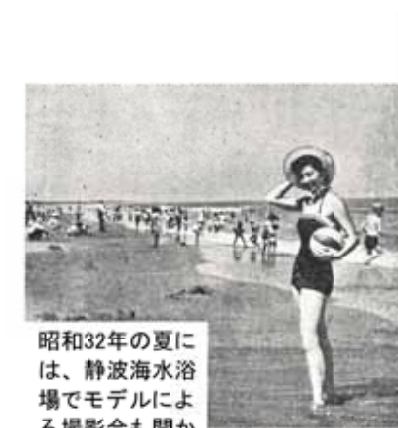
昭和32年の夏には、静波海水浴場でモデルによる撮影会も開かれました

幕末から明治時代の初めにかけて、静波地域の勝間田川河口に整備された川崎港は、東京や横浜、四日市、桑名などへ米や茶などの物資を輸送する海運業が大変盛んで、商港として大変にぎわいました。しかし、明治22年に東京―京都間で東海道線が開通したことによって、沿線の町村が貨物輸送を鉄道にゆだねるようになり、海運業は急速に衰退していきました。 静波海水浴場の発展 「遠浅で砂浜が広い」といわれた静波海岸は、明治時代の終わりに海水浴場として人々に親しまれていました。その後、太平洋戦争を契機に海水浴客は減少しますが、榛原町が誕生した昭和30年以後には、町や各種団体が協力して海水浴場への誘客を図り、その結果、昭和47年8月6日には1日で10万人以上が来場するなど、県下有数の海水浴場に発展しました。 現在では、海水浴客はもとより、県内外から多くのサーファーが訪れる「サーフィンスポット」としても、にぎわいを見せています。