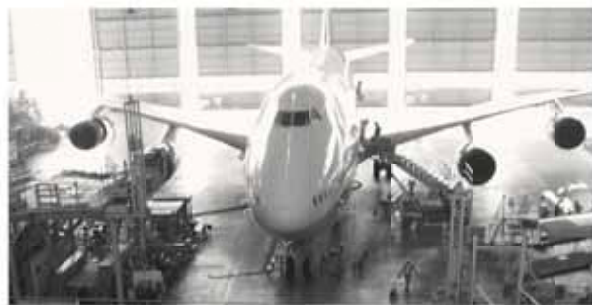
整備工場内の様子