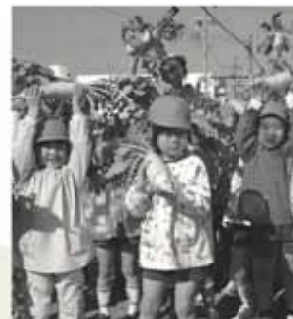
右/大きな大根を一杯抜く園児 上/収穫した大根を高々と上げて大喜びの園児たち