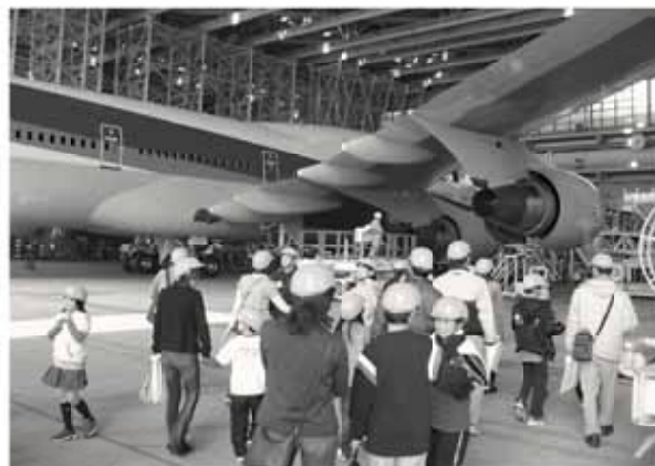
整備工場では航空機が間近で見学できます