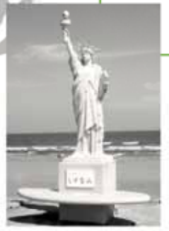
静波海水浴場には、サーフボードに乗った「自由の女神」が建てられています。この女神像は、同海岸のシンボルの存在です