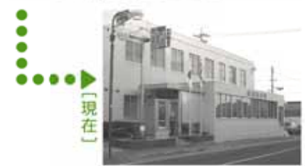
〔写真上〕当時、新藤枝―堀野新田を結んでいた鉄道「駿遠線」の大井川―堀野新田間が、昭和43年3月21日で廃線になりました。〔写真下〕駅舎があったところには、現在、榛原郵便局が建っています。