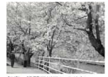
毎春、勝間田川沿いのサクラ並木には、多くの花見客が訪れます