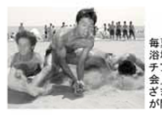
毎夏、静波海水浴場では「ビーチフラッグス大会」など、さまざまなイベントが開かれます