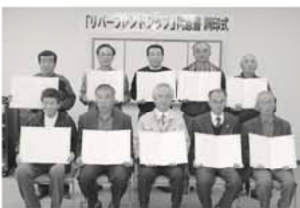
リバーフレンドシップに同意した関係者

●問合せ ●牧之原市御前崎市広域施設組合 消防本部 ☎0537 (85) 2119 ●吉田町牧之原市広域施設組合 消防本部 ☎(32) 1141