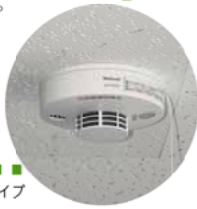
写真は天井取り付けタイプ