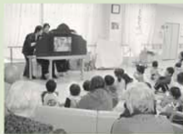
参加者で紙芝居を楽しみました

子どもたちに絵本への関心を深めてもらおうと開催している「親子読書会」の一般体験会が、11月18日に市内道場の特別養護老人ホーム「うたしあ」で開かれました。