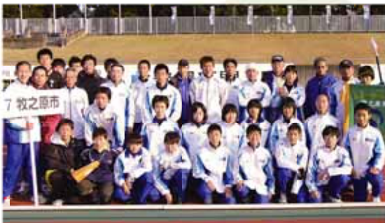
敢闘賞を獲得した牧之原市チーム

県内全市町の小学生から一般男女までの代表選手10人が、わがまちの期待を背にたすきをつなぐ「第7回しずおか市町村対抗駅伝」が、12月2日に県庁前から草薙陸上競技場までの42・195kmを舞台上に開かれ、牧之原市は「市の部」で24位の成績を納めました。 この部門には、23市から28チームが出場。牧之原市は序盤27位と出遅れましたが徐々にばん回し、最終的に昨年の26チーム中25位を上回る24位でゴールしました。