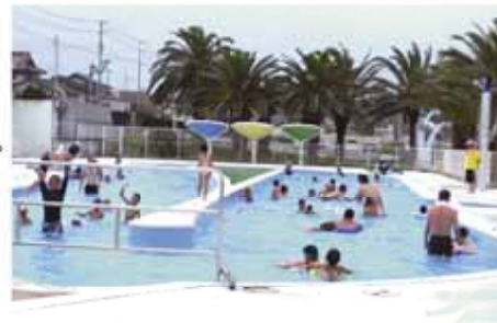
ぶかぶか浮かんで楽しめる 流水プール 幅5m、長さ85mの流れるプールです。浮き輪でぶかぶか浮かんだり、流れに任せて泳いだり、友達や家族みんなで楽しめます。