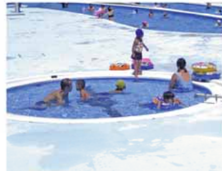
小さな子どもも楽しめる 幼児用プール 大きさは直径4m。深さがほかのプールより浅く、小さな子どもも安心して遊ぶことができます。