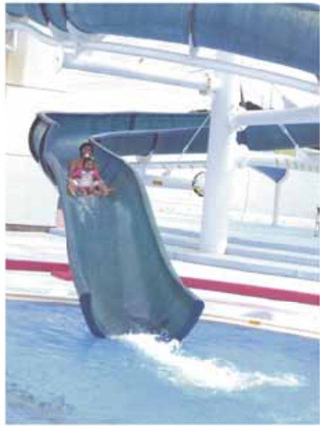
スリル満点！ ウォータースライダー 高さ5m、長さ30mの滑り台。一気に滑り降りるスリルとスピード感に子どもたちは打付けです。